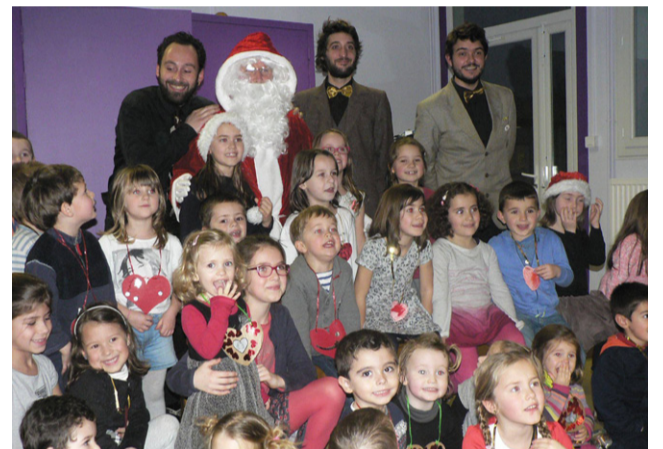
Le Père Noël au milieu des enfants enchantés.

Dès le vendredi de la sortie, ils ont fêté leur départ en vacances sous le signe de la chanson. Après avoir présenté un large répertoire des chants de Noël sous les yeux de leurs parents, les enfants ont réclamé la venue du Père Noël. Vœu exaucé. Petite pause autour d'un goûter multiculturel, chaque famille ayant apporté sa spécialité. Place ensuite au groupe Chansons d'Occasion et ses reprises du répertoire de la chanson française pour faire chanter certains et danser les autres. Fin de la soirée avec la traditionnelle chanson du Petit